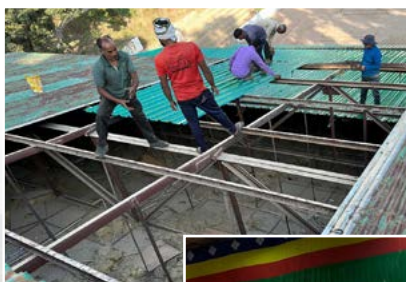
Das Dach wurde neu gedeckt, die Innen- und Außenwände gestrichen, alle Holzböden und Sitzränge geschliffen und neu poliert, die Elektrik neu überholt

Seit nahezu 30 Jahren war nichts an diesem wichtigen Bauwerk gemacht worden. Und so war der Zustand der Halle bedenklich: Kaputte Wände, Lecks im Dach, schlechte Elektrik und auch das Holz der Böden und Sitz-Tribünen musste dringend abgeschliffen und erneuert werden. DANK IHRER HILFE erstrahlt die Halle nun - pünktlich zu Weihnachten - in neuem Glanze! ... Und wird im Februar 2024 zum tibetischen Neujahr auch den Dalai Lama erfreuen, wenn er - wie jedes Jahr zu ‚Losar‘ - das tibetische Kinderdorf von Dharamsala besucht, um hier zu seinen Schützlingen, den Lehrern und Hauseltern zu sprechen.